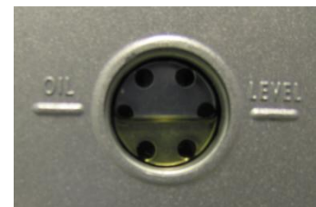
Le niveau d'huile observé ici est de 1/2

1 – Desserrez le bouchon noir de l'orifice d'évacuation. Utilisez un entonnoir pour verser l'huile. Pendant le remplissage, vérifiez le niveau: le volume optimal est obtenu lorsque le niveau se situe entre les deux lignes « min » et « max ». Refermez le bouchon après remplissage.