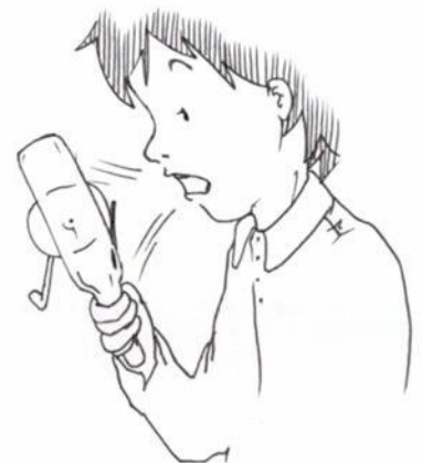
Fig.2 Humidifier l'appareil si l'air est sec